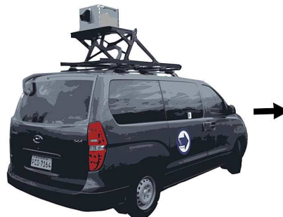
Videos de 4 cámaras con ubicación GPS (precisión submétrica)

RHV dispone de un equipo de mapeo móvil de la más alta tecnología a nivel mundial especializado en la realización de inventarios viales georeferenciados a partir de videos.